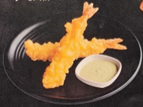
กุ้งทอดกรอบ 120. Crunchy Fried Prawn (2 ชิ้น) 克蘭チー海老天