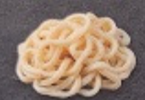
เส้นวุ้นดง 60. Wheat Noodles うどん