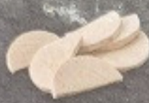
เผือก 60. Taro タロイモ