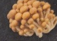
เห็ดชิเมจิ 80. Shimeji Mushroom しめじ