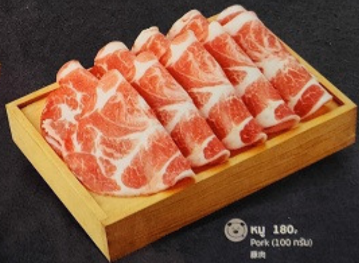
หมู 180. Pork (100 กรัม) 豚肉