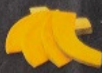
ฟักทอง 60. Pumpkin カボチャ