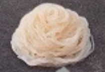
เส้นบุก 70. Konjac Noodles しらたき