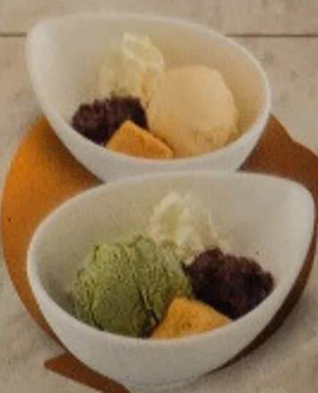
ไอศกรีมส้มยูซุซันเดอ 120. Yuzu Sundae ゆずパフェ