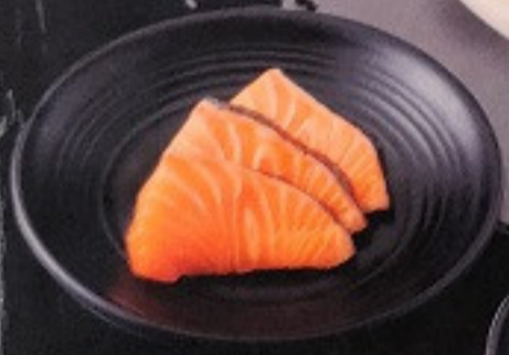
ปลาแซลมอน 120. Salmon (3 ชิ้น) 鮭