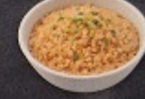
ข้าวผัดกระเทียม 50. Garlic Rice にんにくライス