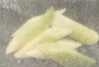
ต้นหอมญี่ปุ่น 60. Japanese Leek 長ねぎ