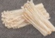
เห็ดเข็มทอง 60. Golden Needle Mushroom えのき