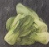
กวางตุ้งอ่อนเต๋ 70. Bok Choy チンゲン菜