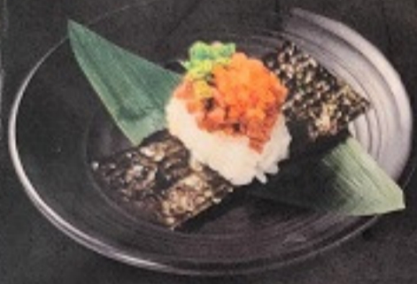
วากิวเทมาคิ 120. Wagyu Temaki (1 ชิ้น) 和牛手巻き