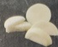
หอมหัวใหญ่ 60. Onion 玉ねぎ