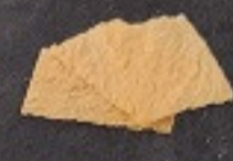
เต้าหู้แผ่นทอด 90. Fried Bean Curd Sheet (3 個) 揚げ湯葉