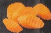
แครอท 60. Carrot ニンジン