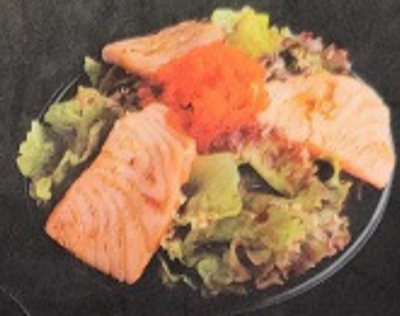
สลัดปลาแซลมอน 160. Salmon Salad サーモンサラダ