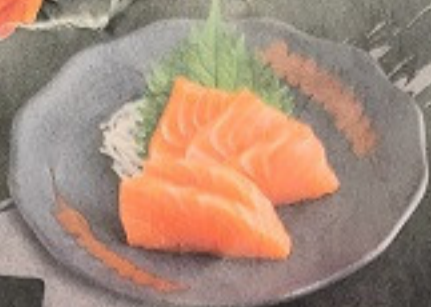
ปลาแซลมอนซาซิมิ 100. Salmon Sashimi (2 ชิ้น) サーモン刺身