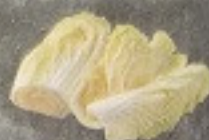
ผักกาดขาว 70. Chinese Cabbage 白菜