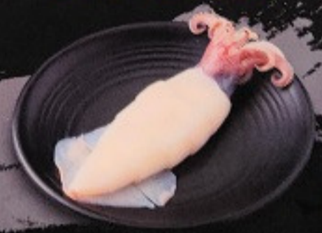
ปลาหมึก 100. Squid (3 ชิ้น) 烏賊