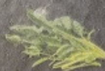
ผักโขม 70. Spinach ほうれん草