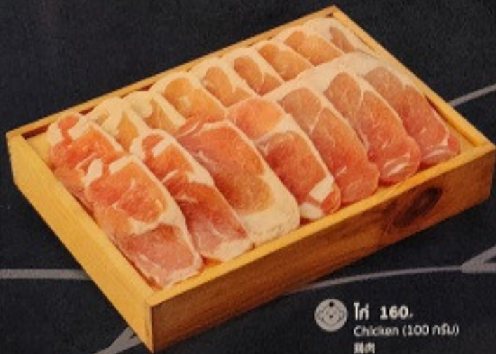
ไก่ 160. Chicken (100 กรัม) 鶏肉