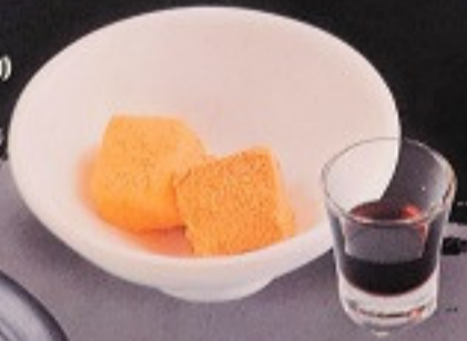
วาราบิโมจิ 30. Warabi Mochi (2 ชิ้น) わらびもち