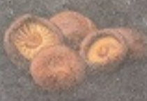
เห็ดหอม 60. Shiitake Mushroom しいたけ