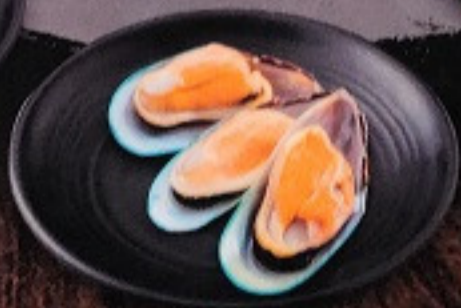
หอยแมลงภู่นิวซีแลนด์ 100. New Zealand Mussel (3 ชิ้น) ニューージーランド ムール貝