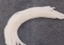
วุ้นเส้นญี่ปุ่น 70. Japanese Vermicelli (50 n/su) くずきり