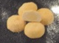
เต้าหู้ชีส 90. Cheese Tofu (3 個) チーズ豆腐