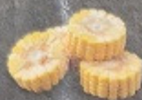
ข้าวโพด 60. Corn トウモロコシ