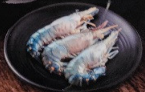
กุ้ง 170. Prawn (3 ชิ้น) 海老