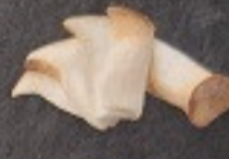
เห็ดออรินจิ 80. Eringi Mushroom エリンギ