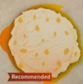
ไอศกรีมส้มยูซุ 70. Yuzu Ice Cream ゆずアイスクリーム