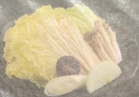
ชุดผักสุกี้ยากี้, ซาบู ซาบู 150. Sukiyaki, Shabu Shabu Vegetable Set