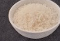
ข้าวญี่ปุ่น 30. Japanese Rice 白ご飯