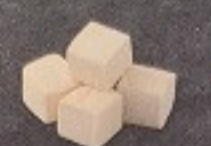
เต้าหู้ปลา 90. Fish Tofu (3 個) 魚豆腐