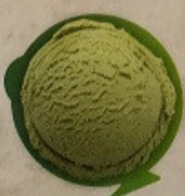
ไอศกรีมชาเขียว 70. Matcha Ice Cream 抹茶アイスクリーム