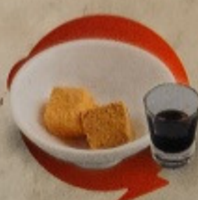
วาราบิโมจิ 30. Warabi Mochi わらびもち