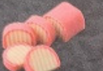
คามายาโกะ 90. Fish Cake (4 個) かまぼこ