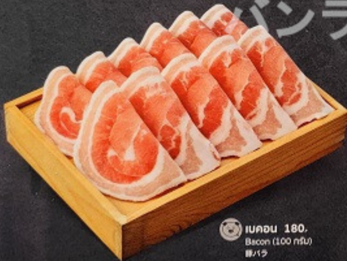
เบคอน 180. Bacon (100 กรัม) ベーコン