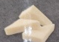
โมจิ 90. Japanese Rice Cake 餅 (4 個)