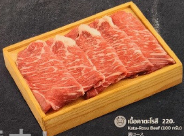
เนื้อกาทะโรสุ 220. Kata-Rosu Beef (100 กรัม) 肩ロース