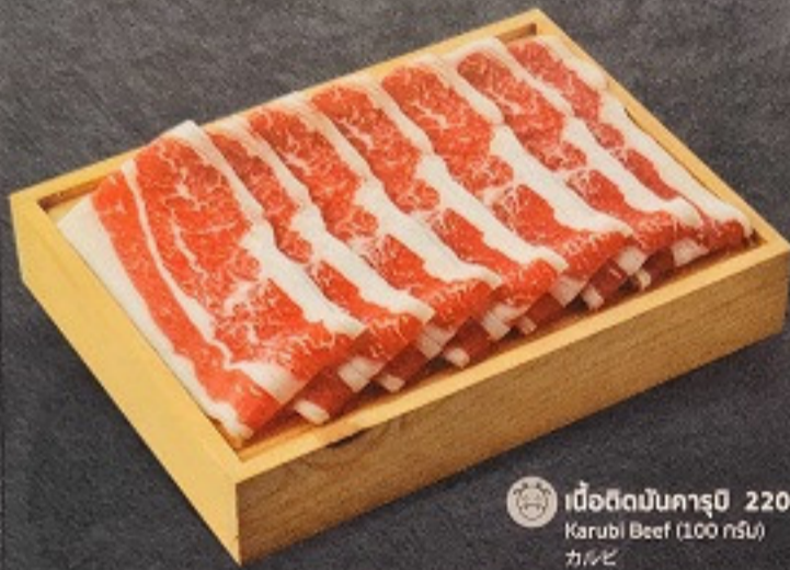
เนื้อติดมันคารุบิ 220. Karubi Beef (100 กรัม) カルビ