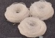
วุ้นเส้น 60. Vermicelli 春雨