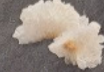
เห็ดหูหนูขาว 60. White Jelly Fungus 白きくらげ