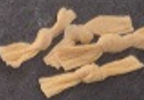
ฟองเต้าหู้หูกโบว์ 90. Bean Curd Skin (3 個) 結び湯葉