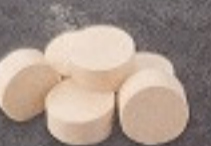
เต้าหู้ 60. Tofu (4 個) 豆腐