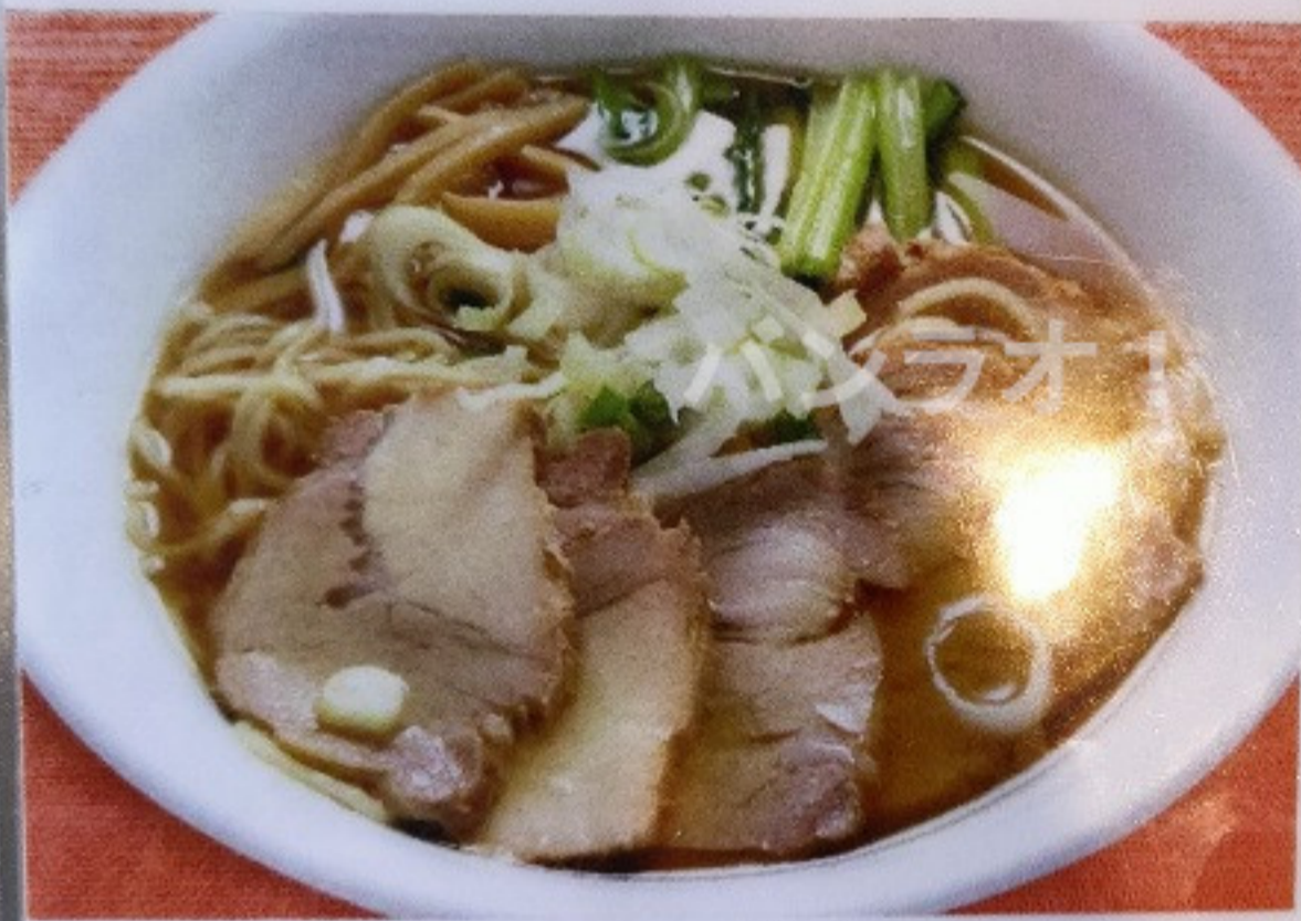
チャーシューメン CHASHUMEN