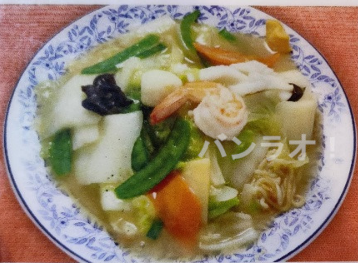
五目ヤキソバ GOMOKU YAKISOBA