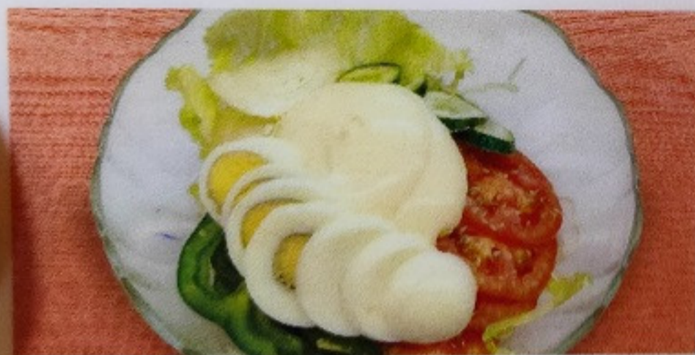
野菜サラダ YASAI SARADA