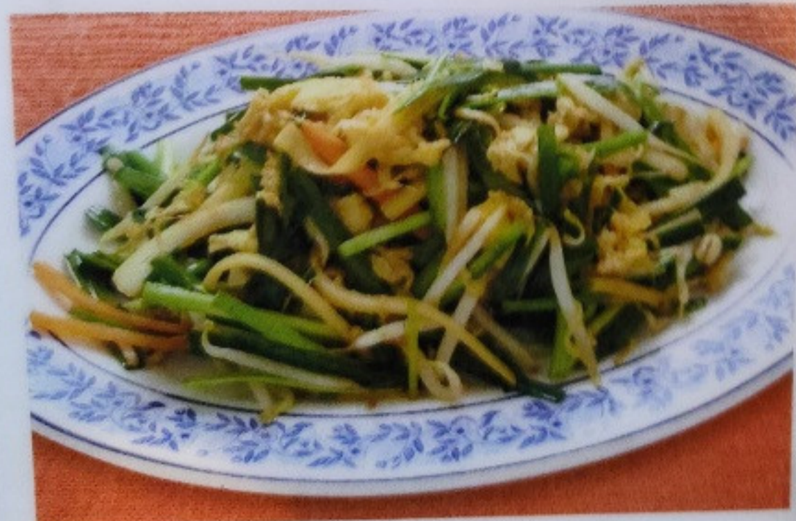
ニラ玉炒め NIRATAMA ITAME