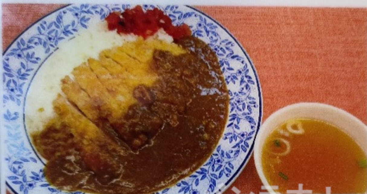
カツカレーライス KATSU KARERICE