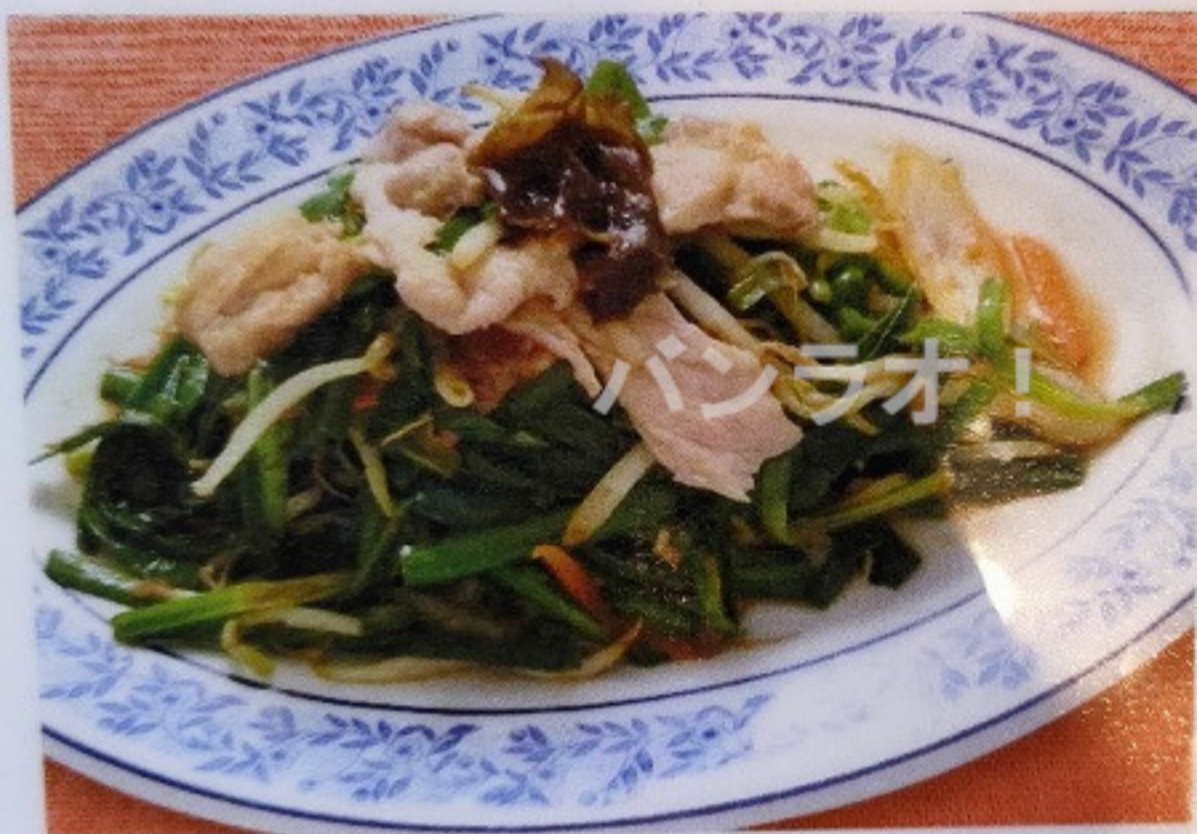
肉ニラ炒め NIKUNIRA ITAME