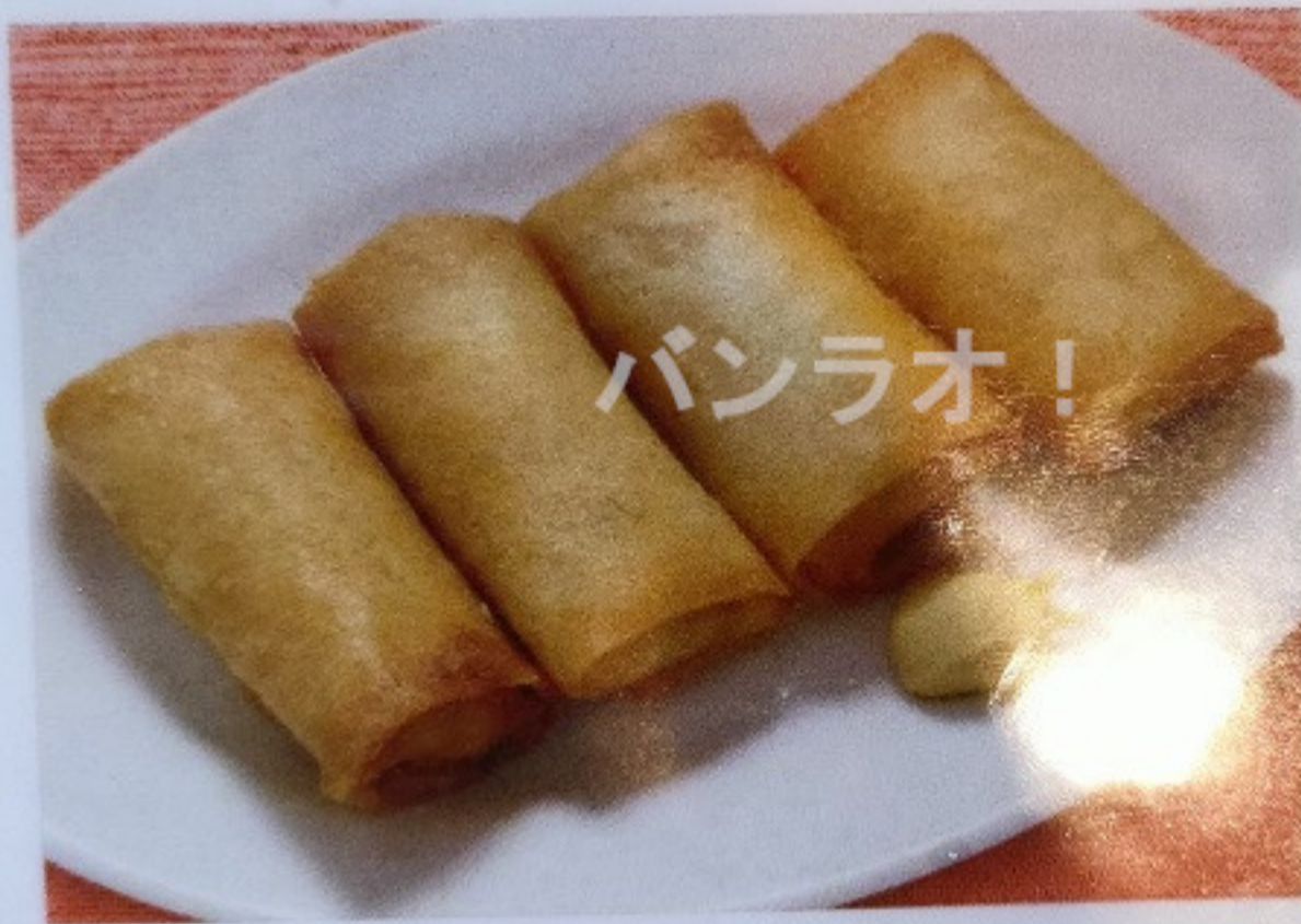
春巻 HARUMAKI 80B