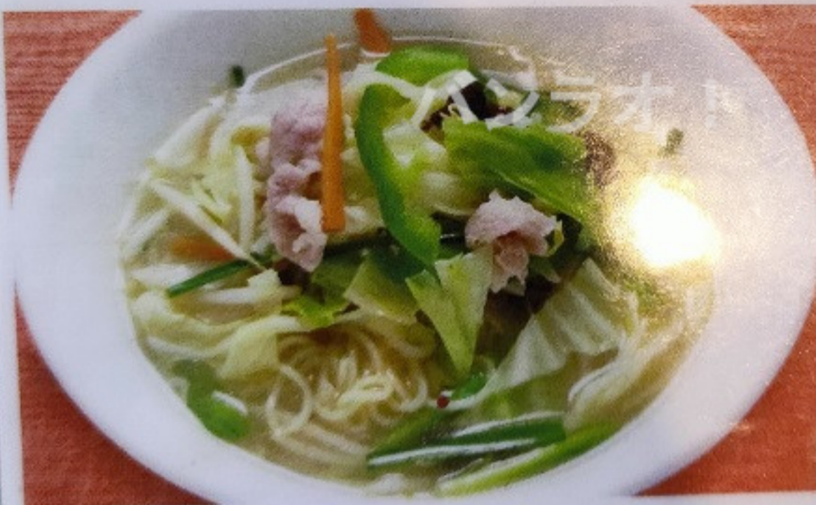
タンメン TANMEN 170 ¥