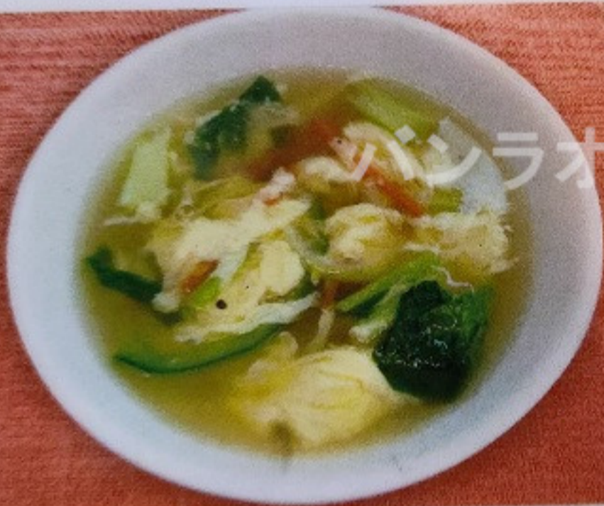
玉子スープ TAMAGO SOUP