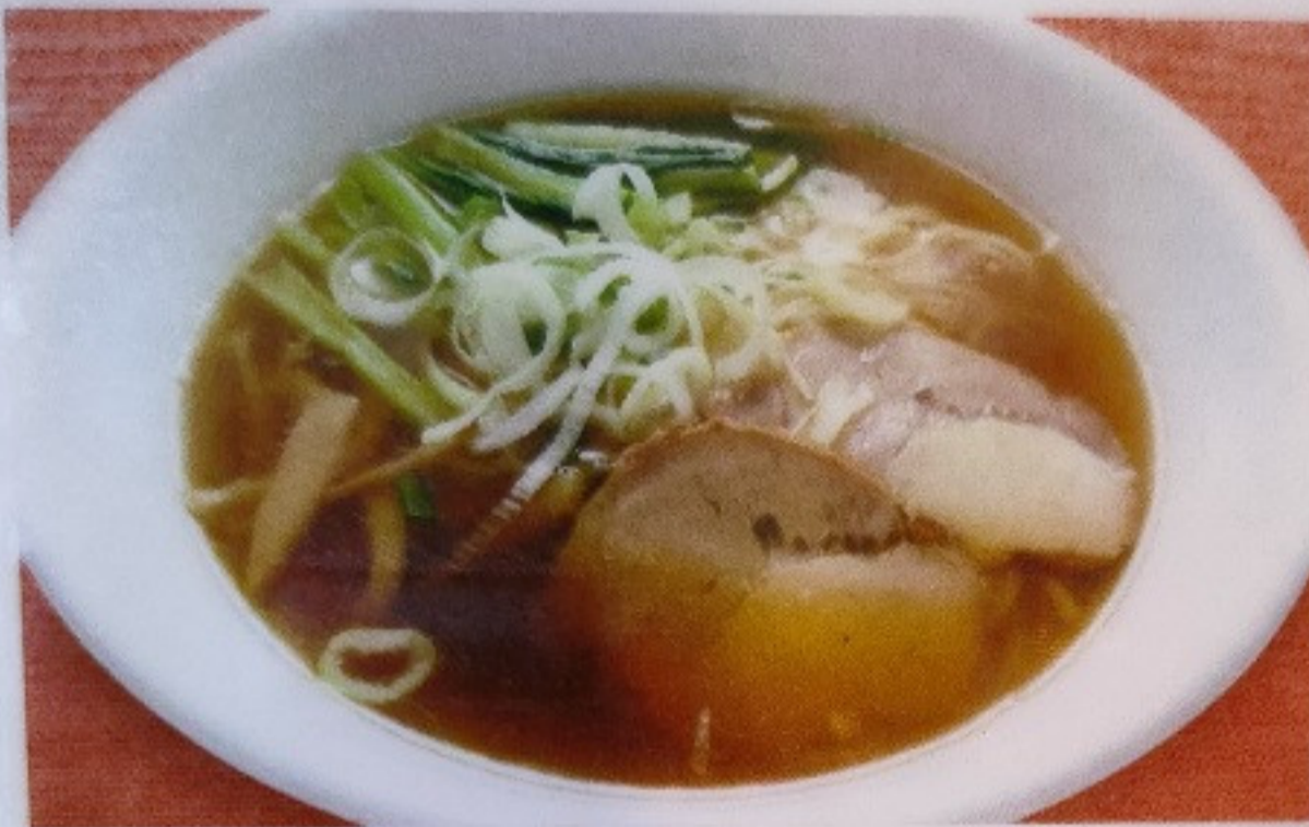
ラーメン RAMEN 150 ¥