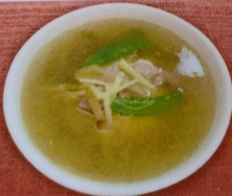
搾菜スープ ZASAI SOUP