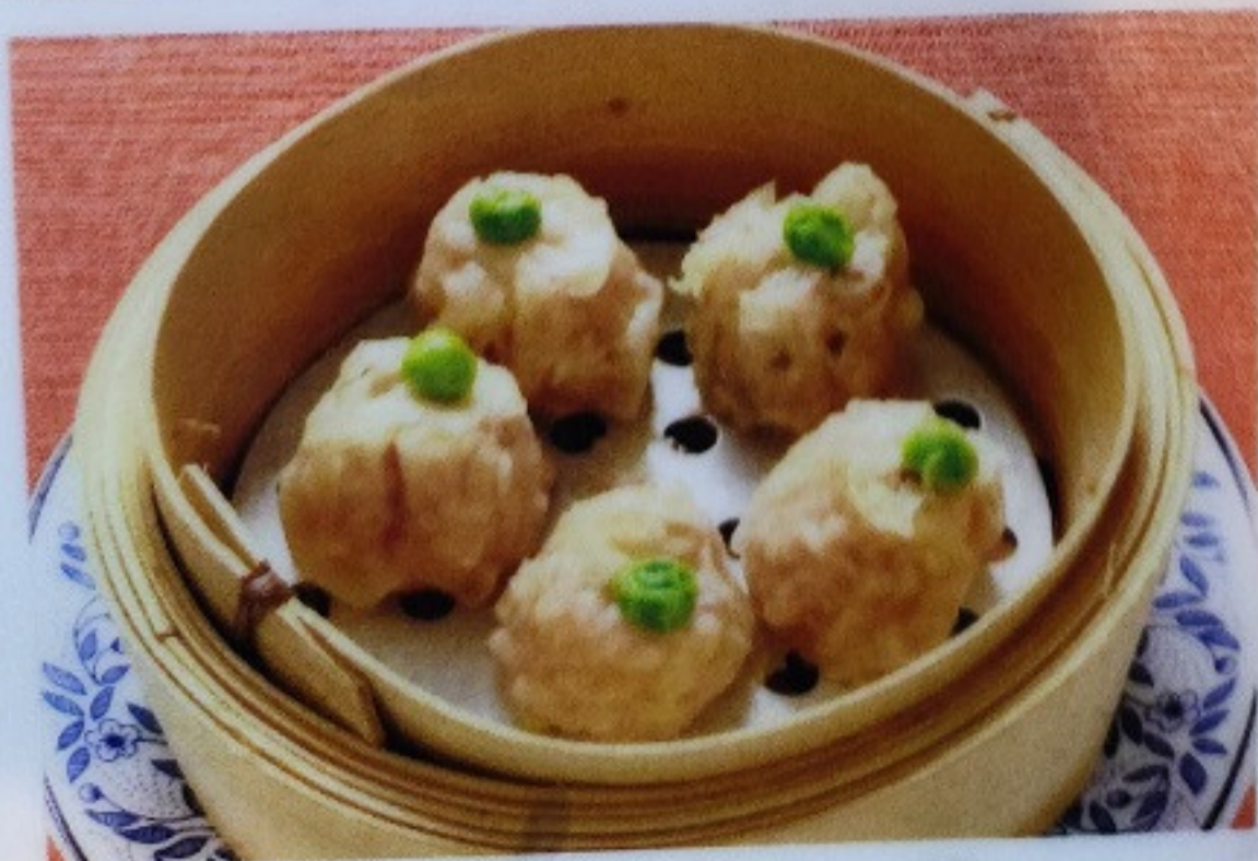
シューマイ SHUMAI 80B