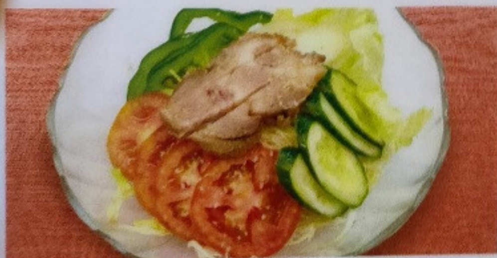
中華風サラダ CHUKAFU SARADA