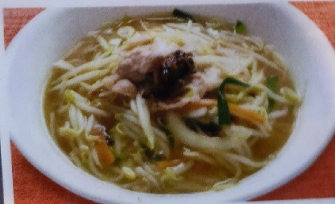
モヤシソバ MOYASHISOBA 170 ¥