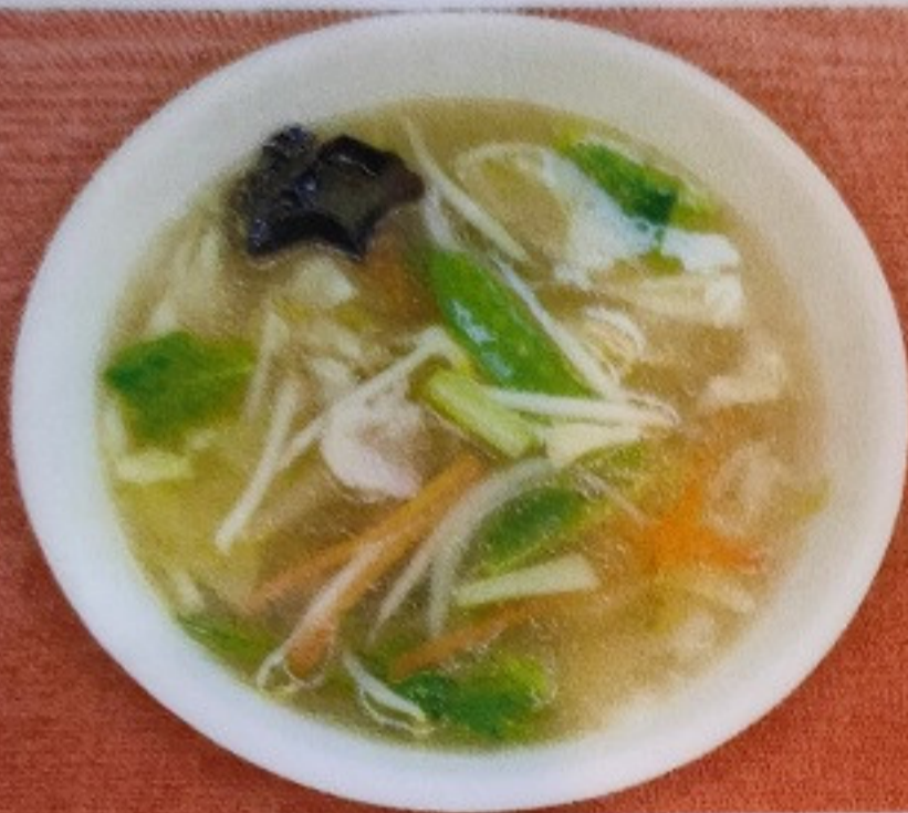
野菜スープ YASAI SOUP