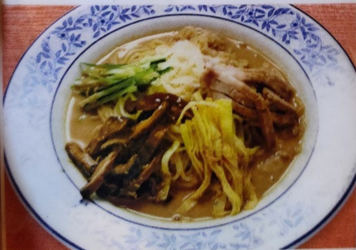
四川風冷しソバ SHISENFU HIYASHI