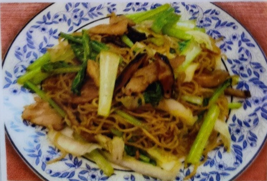
上海ヤキソバ SHANHAI YAKISOBA