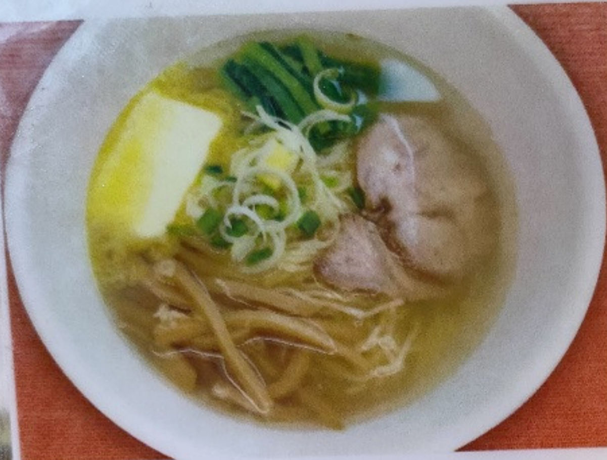
塩バターラーメン SHIOBATA RAMEN