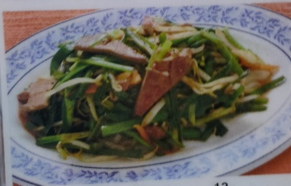
レバニラ炒め REBANIRA ITAME