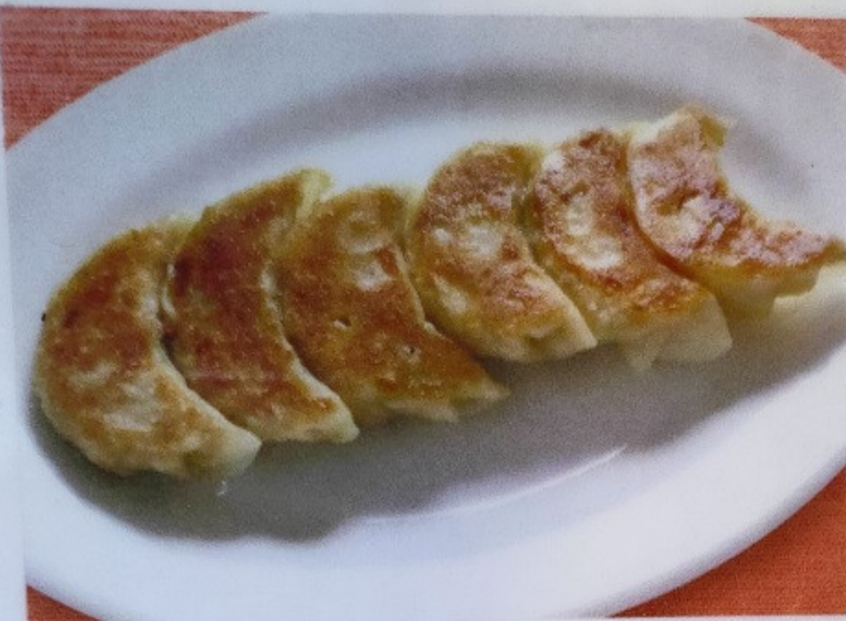
餃子 GYOUZA 80B