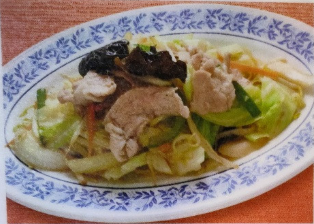
肉野菜炒め NIKUYASAI ITAME