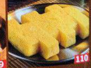
居酒屋の玉子焼き ไช้หวานสไตล์อิซากายะ Izakaya-style egg rolls 78B