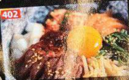
牛ユッケの石焼ビビンバ บีบิบมันบายงย่างหิน Beef Yukhoe Stone Grilled Bibimbap 268B