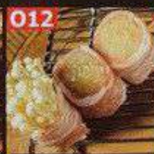
マヨヤングコーン豚巻き串 48B หมูพันข้าวโพดอ่อนมายองเนสเสียบไม้ Mayonaisse young corn pork skewers