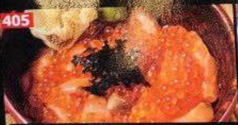
極上サーモンいくらミニ丼 ข้าวหน้าปลาแซลมอนและไข่ปลาแซลมอนคึ่ง Salmon & salmon roe mini bowl 298B