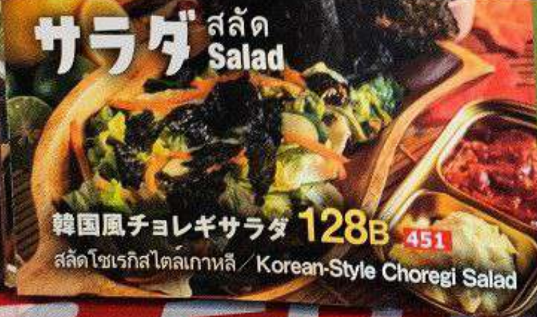
韓国風チョレギサラダ 128B 451 สลัดโซเรกิสไตล์เกาหลี / Korean-Style Choregi Salad