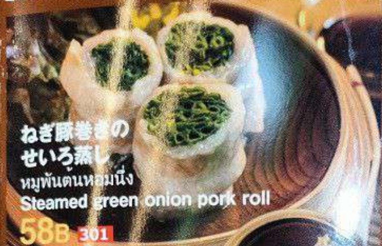
ねぎ豚巻き のせいろ蒸し หมูพันต้นหอมหนึ่ง Steamed green onion pork roll