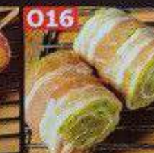
パイナップル豚巻き串 58B หมูพันสับปะรดเสียบไม้ Pineapple pork skewers