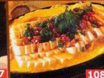
韓式麻婆豆腐 มาโปโตฟูสไตล์เกาหลี Korean Style Mapo-tofu 188B