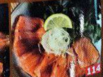
新鮮サーモンのカルパッチョ แซลมอนสดครีปปาโช Fresh salmon carpaccio