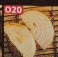
じゃがバター串 38B มันฝรั่งและเนยเสียบไม้ Potato Butter Skewers