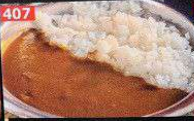
มานาโอのだろどろミニカレー แกงกระหรี่มินิ Manao's muddy mini curry 168B