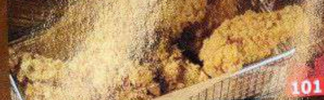
サクサククリスピーチキン (ハニーマスタード、チーズ、甘辛ソース、ノーマル) 198B เคียงกรอบเกาหลี (มีสตาร์ทน้ำผึ้ง, ซีส, ยั้งนย้อม) Korean crispy chicken (honey mustard, cheese, yangnyeom)