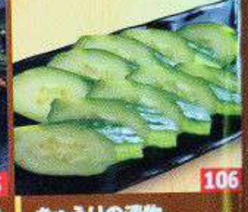
きゅうりの漬物 แดงกวาดอง Pickled cucumber 88B