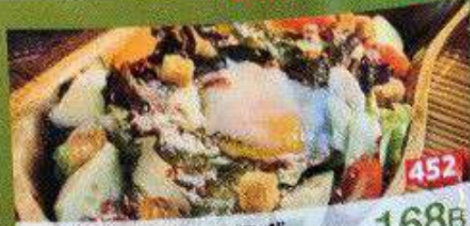
ハイ!シーザーサラダ 168B 452 ไฮซีซาร์สลัด / Caesar Salad 獲れたて野菜スティック 98B 453 ผักแหว่ง / Vegetable sticks