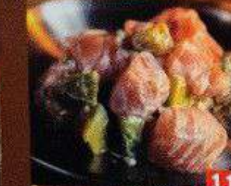
新鮮サーモンとアボカドのカルタルソース ซอสอาหารทะเลมอนสดและอะโวคาโด Fresh salmon and avocado tartar sauce 228B