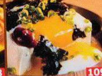
韓国式冷奴 เต้าหู้เย็นสไตล์เกาหลี Korean Style Cold Tofu 98B