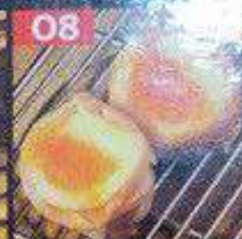
アボカドチーズ豚巻き串 98B อะโวกาโดชีสเสียบไม้ Avocado cheese pork skewers