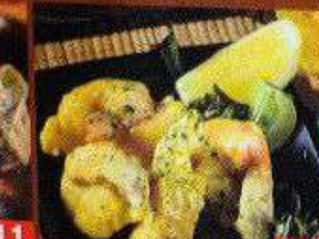
ぷりっと海老のマヨネーズ炒め กุ้งผัดมายองเนส Stir-fried shrimp with mayonnaise 228B