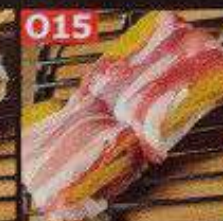
マンゴー豚巻き串 58B หมูพันมะม่วงเสียบไม้ Mango pork skewers