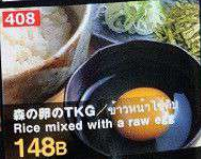
森の卵のTKG / ข้าวหน้าไข่ดิบ Rice mixed with a raw egg 148B 日本の白米 ข้าวญี่ปุ่น / Japanese rice 並 / กลาง 50B 大 / ใหญ่ 65B 409 410