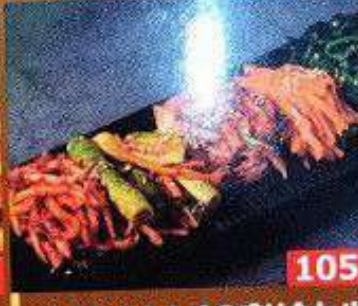
ナムルとキムチの盛り合わせ เซตกิมจิ Kimchi Set 118B