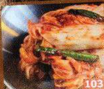
激旨キムチ 激旨 Kimchi 58B