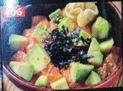
新鮮サーモンアボカド丼 ข้าวหน้าแซลมอนอะโวคาโด Fresh salmon avocado bowl 248B