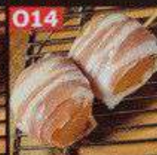
ほうれん草チーズ豚巻き串 78B หมูพันผักโขมชีสเสียบไม้ Spinach cheese pork skewers