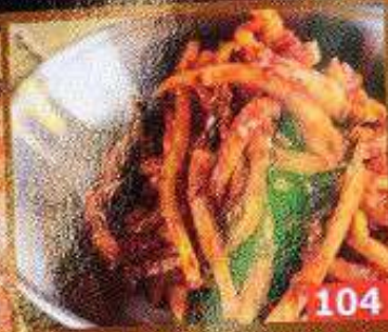
パパイヤキムチ กิมจิมะละกอ Papaya Kimchi 58B