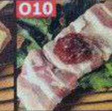
キムチチーズ豚巻き串 78B กิมจิชีสเสียบไม้ Kimchi cheese pork skewers