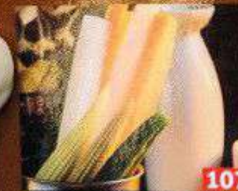
特製バーニャカウダー Bagna Cauda Special Bagna Cauda 148B