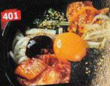
じゅうじゅう石焼ビビンバ บีบิบมันบายงหิน Stone-grilled bibimbap 228B