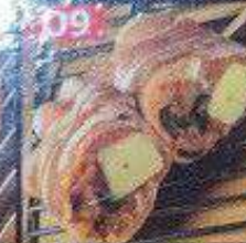
豚エッグ巻き串 68B หมูพันไข่เสียบไม้ Pork egg skewers