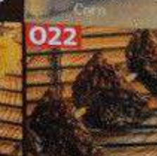
サツマイモ串 28B มันหวานเสียบไม้ Sweet Potato Skewers