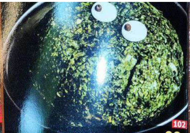
Mr. マナオのポテトサラダ 98B สลัดมันฝรั่ง Mr. Manao / Mr. Manao's Potato Salad