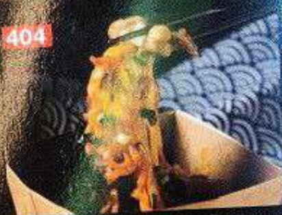
コリアンスタイル激辛チーズ焼きそば ยากิโซบะผัดชีสสไปซี่สไตล์เกาหลี Korean style spicy cheese fried noodles 198B