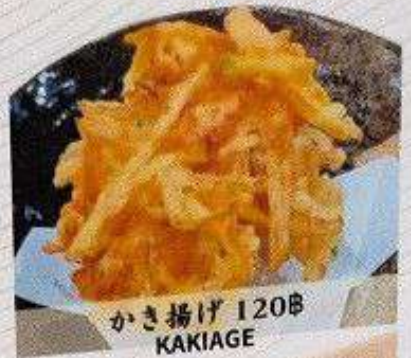
かき揚げ 120B KAKIAGE