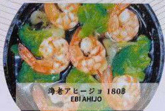
海老アヒージョ 180B EBI AHIJO