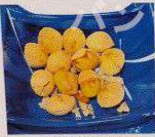
炙り銀杏 120円 ABURI GINNAN