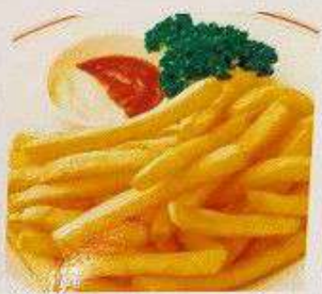
ポテトフライ 80円 FRENCH FRIED POTATO