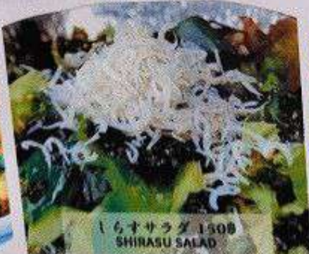
しらすサラダ 150円 SHIRASU SALAD