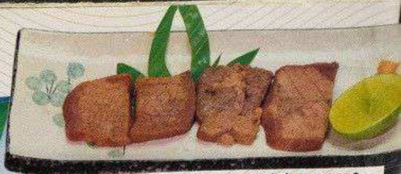
仙台牛タン 380円 SENDAI GYUTAN