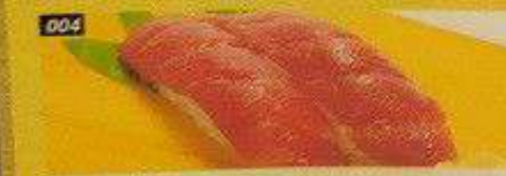
004 キハダ KIHADA MAGURO Bangkok 160B