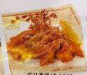
ゲソ唐揚げ 120B GESO KARAAGE