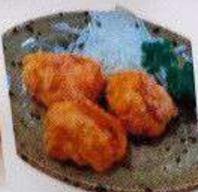
からあげ 3個 80B KARAAGE 3pc