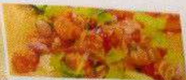
サーモンヤム 200円 SALMON YAM