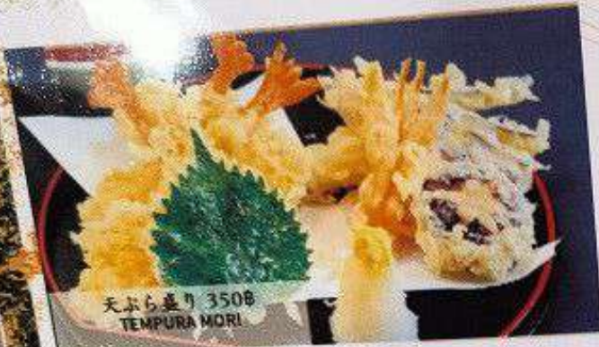
天ぷら盛り 350B TEMPURA MORI