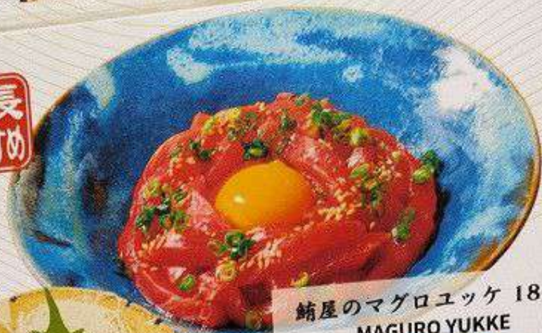
鯖屋のマグロユッケ 180円 MAGURO YUKKE