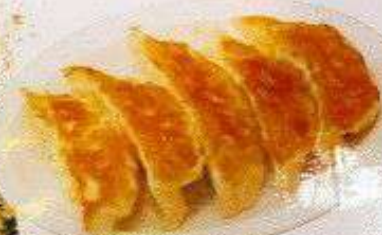
餃子5個 80円 GYOZA