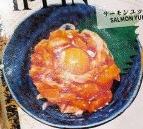
サーモンユッケ 220円 SALMON YUKKE