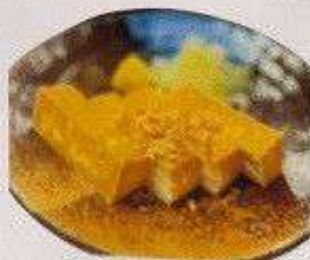
厚揚げ 80円 ATSUAGE TOFU