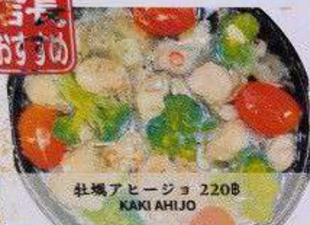
牡蠣アヒージョ 220B KAKI AHIJO