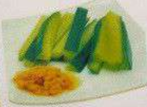
もろきゅう 120円 MORO KYU