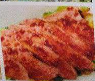
ローストビーフサラダ 220円 ROAST BEEF SALAD