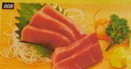
008 中トロ CHUTORO Bangkok 700B