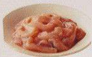
塩辛 120円 SHIOKARA