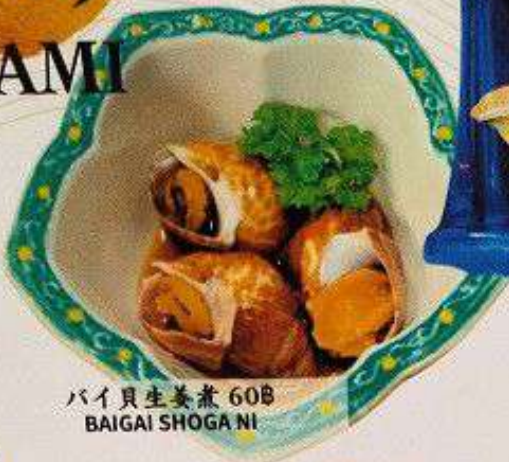
バイ貝生姜煮 60円 BAIGAI SHOGA NI