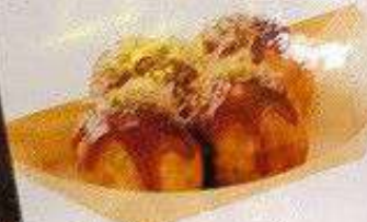
たこ焼き 120円 TAKOYAKI