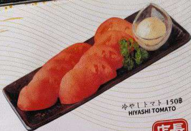
冷やしトマト 150円 HIYASHI TOMATO