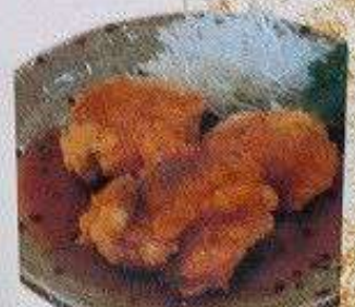
からあげ(鰯かけ) 3個 100B KARAAGE (ANKAKE) 3pc

VAT7%とサービス料10%別途頂戴いたします。 This price excludes 7% VAT and 10% service charge.