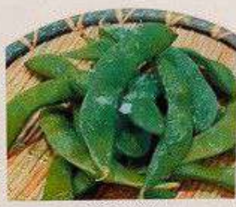
枝豆 80円 EDAMAME