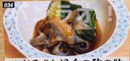
034 かじ取りと胡瓜の酢の物 KAJITORI KYURI SUNOMONO เนื้อทูนางู กับแตงกวาหมักน้ำส้มสายชู 120B