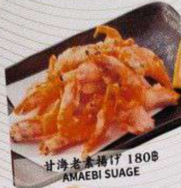
甘海老素揚げ 180B AMAEBI SUAGE