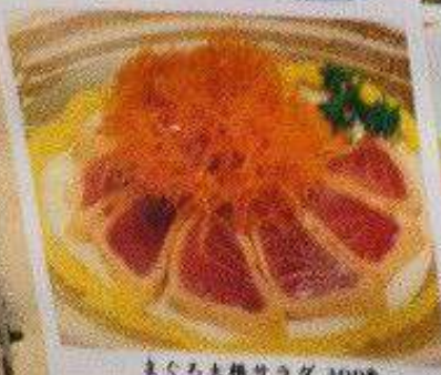
まぐろ大根サラダ 300円 MAGURO DAIKON SALAD