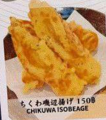
ちくわ磯辺揚げ 150B CHIKUWA ISOBEAGE