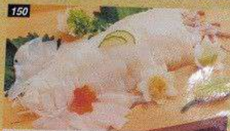
150 ヤリイカ姿造り YARIIKA SUGATADUKURI ยาริอิคาซึเกะดุกุริ 240B