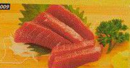
009 赤身 AKAMI Bangkok 500B