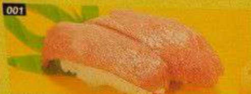
001 大トロ OOTORO Bangkok 600B