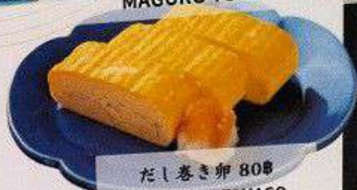
だし巻き卵 80円 DASHIMAKI TAMAGO