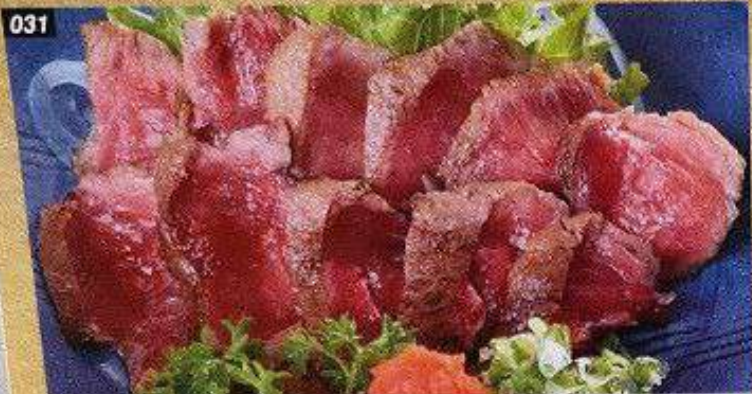
031 本館ほほタタキ HONMAGURO HOHO TATAKI แก๊งปลาทูน้ำแข็งชิ้น 500B