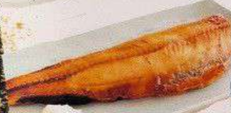
鱈ホッケ(半身) 250円 SHIMA HOKKE (HALF)