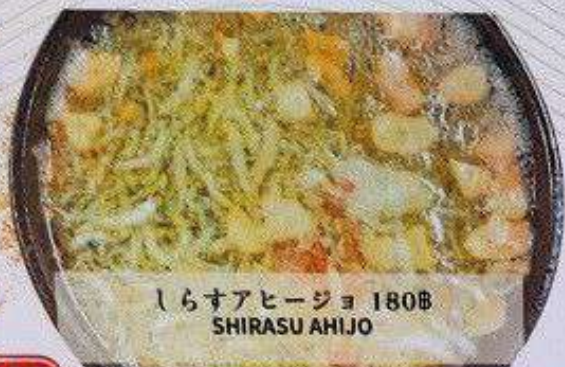
しらすアヒージョ 180B SHIRASU AHIJO