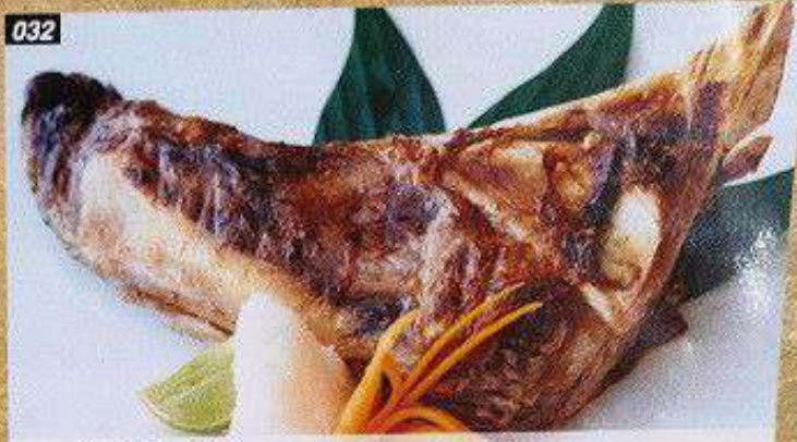
032 のど塩焼 NODO SHIOYAKI คอกปลาทูน้ำย่างเกลือ 600B