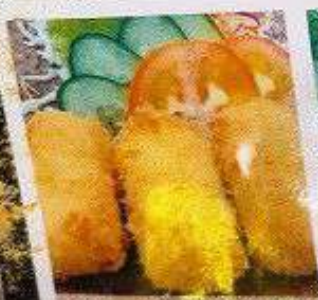
クリームコロッケ 3個 80B CREAM KOROKKE 3pc