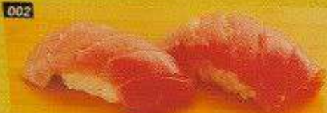
002 中トロ CHUTORO Bangkok 400B