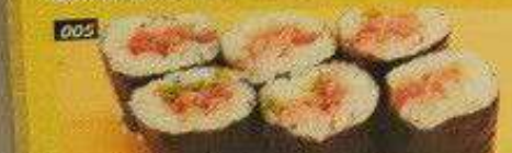
005 ネギトロ巻 NEGITORO MAKI Bangkok 200B