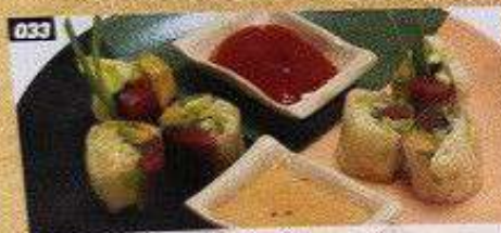
033 マグロ生春巻 MAGURO NAMA HARUMAKI ปอเนื้อสดใส่นางู 300B