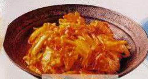
豚キムチ 120円 BUTA KIMUCHI