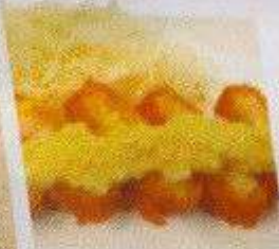
海老カツ 120B EBI KATSU