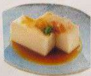
冷奴 80円 HIYA YAKKO