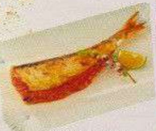
イワシ明太 120円 IWASHI MENTAI