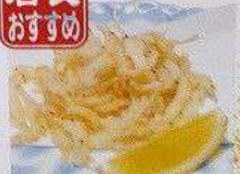
白魚唐揚げ 150B SHIRAUO KARAAGE