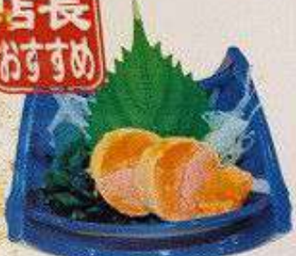
あん肝 230円 ANKIMO