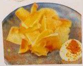
エイヒレ 120円 EI HIRE