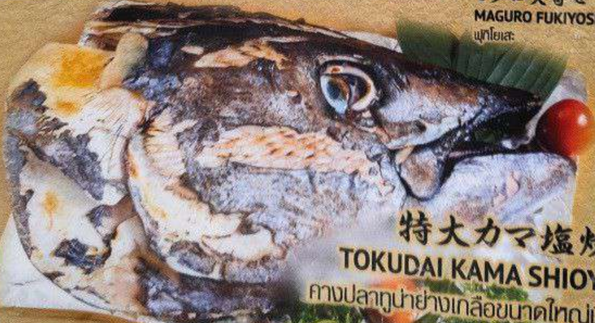
037 特大カマ塩焼き TOKUDAI KAMA SHIOYAKI คอกปลาทูน้ำย่างเกลือขนาดใหญ่พิเศษ 2,500B