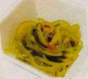
中華わかめ 80円 CHUKA WAKAME