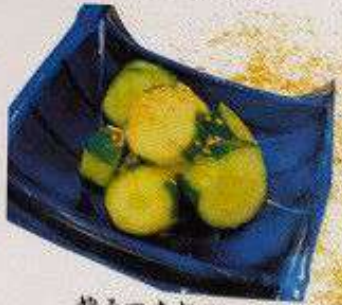
やみつき胡瓜 80円 YAMITSUKI KYURI