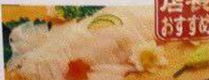
ヤリイカ姿造り 240円 YARIIKA SUGATA DUKURI (SASHIMI)