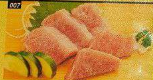
007 大トロ OOTORO Bangkok 1,100B