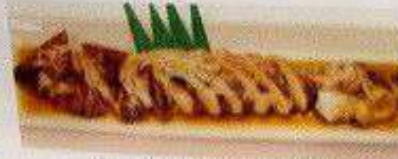
ヤリイカ柔らか煮 240円 YARIIKA YAWARAKANI