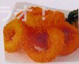
イカフライ 120B IKA FRIES