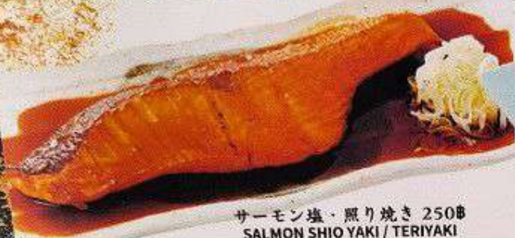
サーモン塩・照り焼き 250円 SALMON SHIO YAKI / TERIYAKI