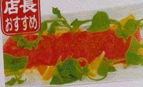
まぐろカルパッチョ 200円 MAGURO CARPACCIO