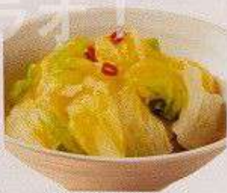
白菜浅漬け 80円 HAKUSAI ASADUKE