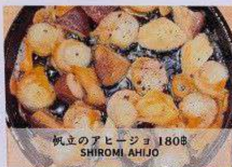
帆立のアヒージョ 180B SHIROMI AHIJO