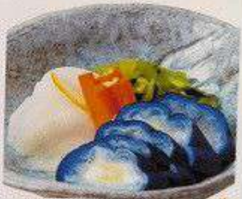
日替わり漬物4種 150円 TSUKEMONO 4kinds