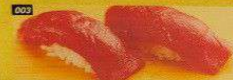
003 赤身 AKAMI Bangkok 300B