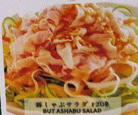
豚しゃぶサラダ 120円 BUTASHABU SALAD