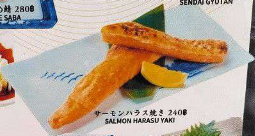
サーモンハラス焼き 240円 SALMON HARASU YAKI