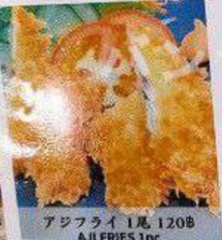
アジフライ 1尾 120B AJI FRIES 1pc