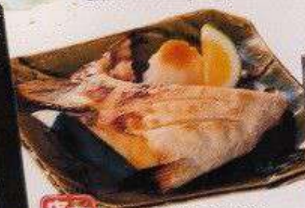
店長 おすすめ ブリかま塩焼き 300円 BURIKAMA SHIO YAKI