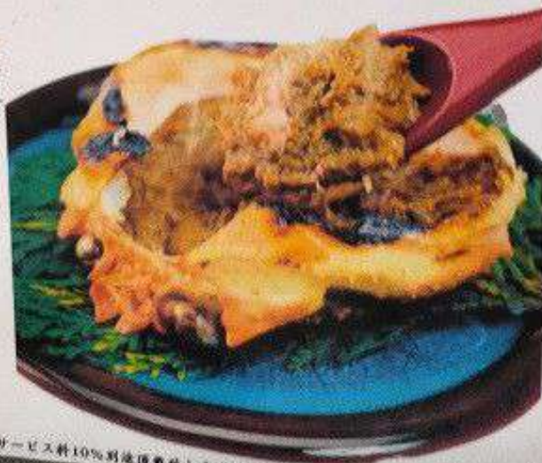
カニ味噌甲羅焼き 120円 KANIMISO