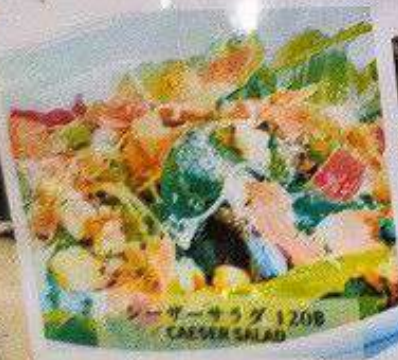
シーサーサラダ 120円 CAESAR SALAD