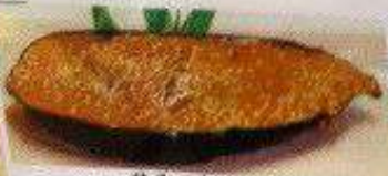
茄子田楽 150円 NASU DENGAKU