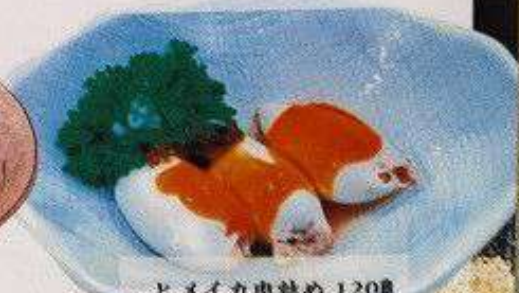
ヒメイカ肉詰め 120円 HIME IKA NIKUDUME