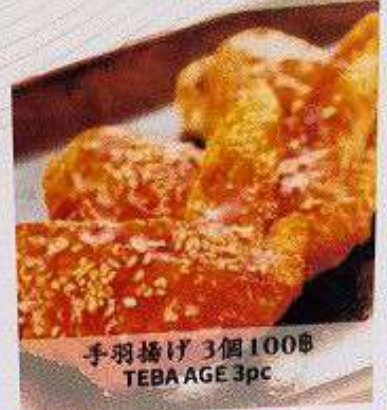
手羽揚げ 3個 100B TEBA AGE 3pc