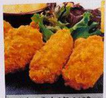
カキフライ 3個 140B KAKI FRIES 3pc