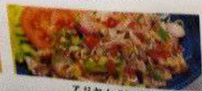
アジヤム 200円 AJI YAM