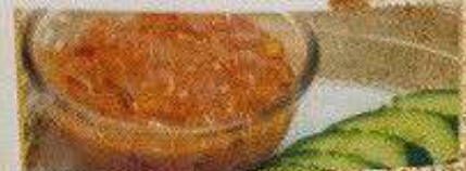
塩辛ヤム 180円 SHIOKARA YAM