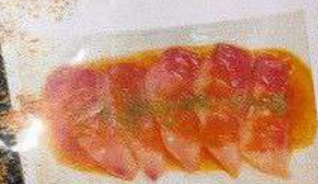
ぶりカルパッチョ 220円 BURI CARPACCIO