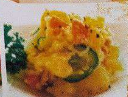
ポテトサラダ 60円 POTERO SALAD