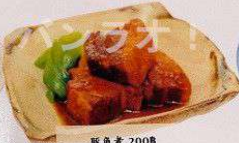
豚角煮 200円 BUTA KAKUNI