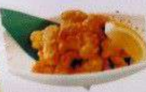
たこ唐揚げ 200B TAKO KARAAGE