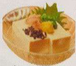
冷奴(塩昆布) 100円 HIYA YAKKO SHIO KONBU