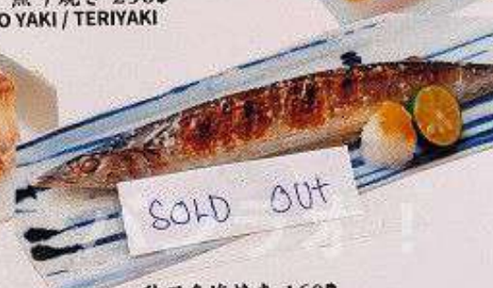
秋刀魚塩焼き 160円 SANMA SHIO YAKI