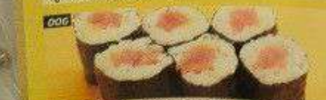
006 鉄火巻 TEKKA MAKI Bangkok 200B