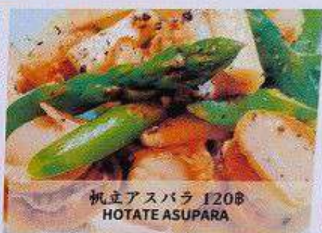
帆立アスパラ 120B HOTATE ASUPARA