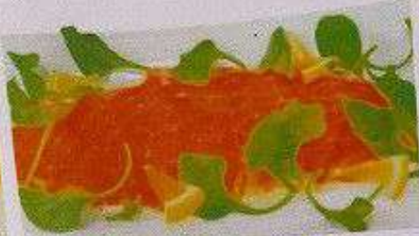
サーモンカルパッチョ 220円 SALMON CARPACCIO