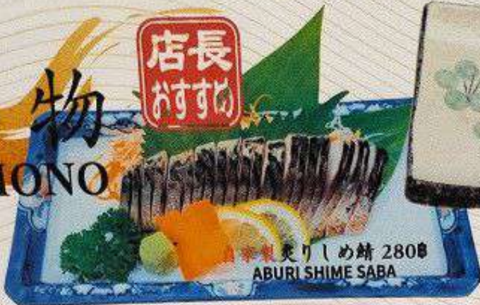
香煎炙りしめ鯖 280円 ABURI SHIME SABA