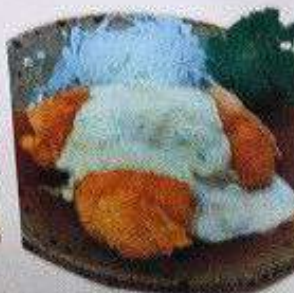
からあげ(南蛮) 3個 100B KARAAGE (NANBAN) 3pc