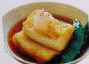
揚げ出し豆腐 200B AGEDASHI TOFU