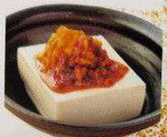
冷奴(ラー油) 140円 HIYA YAKKO RA-YU