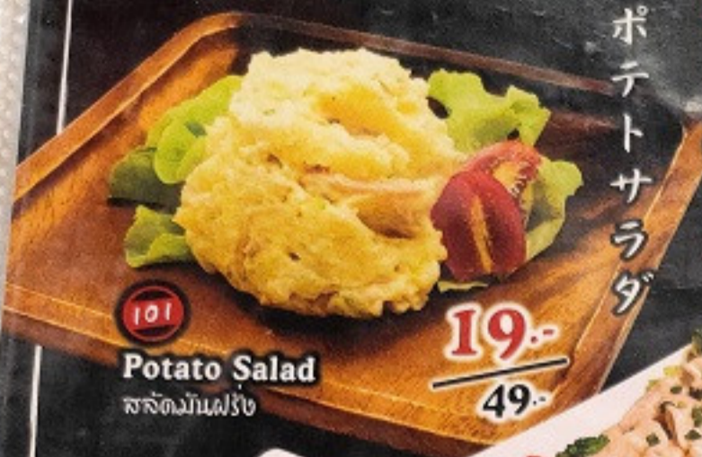
101 Potato Salad สลัดมันฝรั่ง