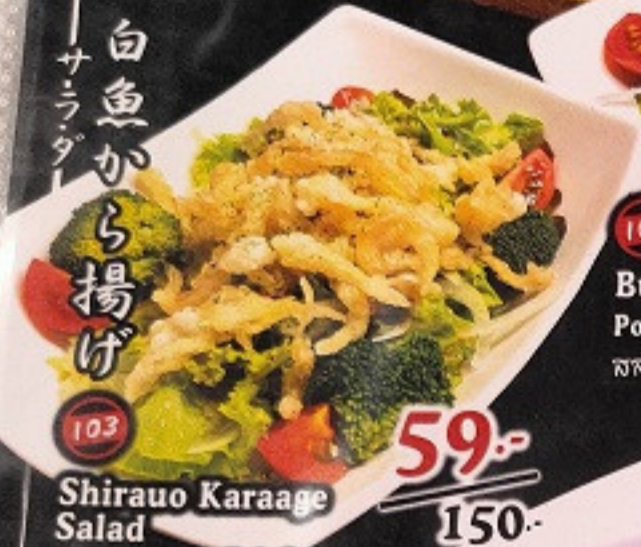
103 Shirauo Karaage Salad Japanese Icefish Salad สลัดปลาจีนทอดกรอบ