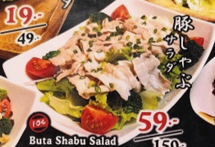
104 Buta Shabu Salad Pork Shabu-shabu Salad สลัดหมูชabu