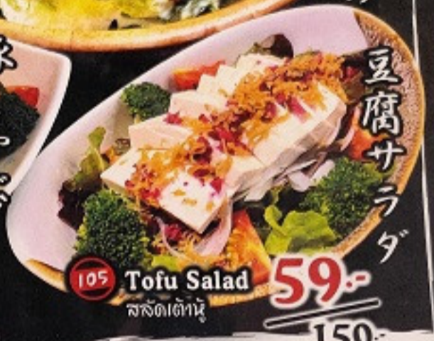
105 Tofu Salad สลัดเต้าหู้