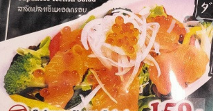
083 Salmon Ikura Salad Salmon & Salmon Roe Salad สลัดแซลมอนและไข่แซลมอน