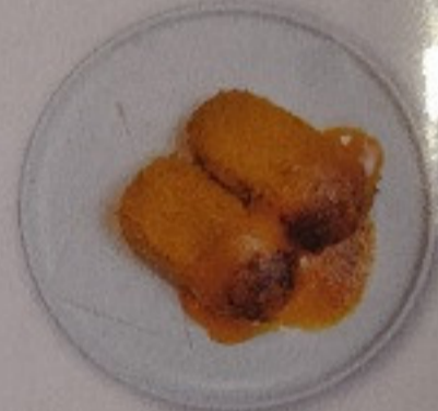
Crab Cream Croquette with Uni Sauce 230.-

スパイシー サーモンチーズボール "チーズをサーモンのミンチのフライ +スパイシーなオリジナルソース" แซลมอนชีสบอล เสิร์ฟ พร้อมซอสเผ็ดร้อนสูตรออริจินอล