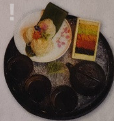
Uni Somen 390.-

九州の鳥の水炊き鍋の出汁と、 自家製太麺の鶏ラーメンです ラーメンチキンเส้นหนาแบบโฮมเมด และน้ำซุปก็เคี่ยวด้วยไก่จากภูมิภาคคิวชู *ลูกค้าสามารถปรุงรสความเข้มข้นได้เอง (เสิร์ฟพร้อมเกลือธรรมชาติ)