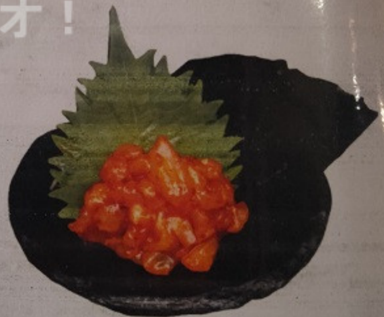
Born for Beer 180.-