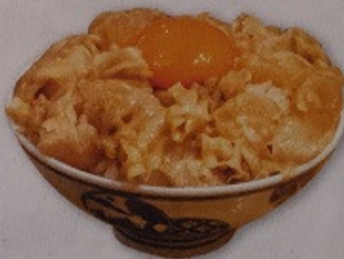
Hotate Smoke Don 480.-

ตั้งพรีเมียมหน้าเนื้อวากิวสเต็ก พรูวทราส์ และไข่ดอง