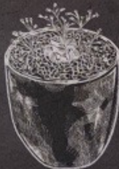
HOJICHA MANGO 250.-

รสชาติและกลิ่นที่ร้อนแรงของซิงเกิ้ลและเครื่องเทศเมื่อทานคู่กันเนื้อ และเนยบวกรายากของ TEPPEN แล้ว รับรองว่ารสชาติความเย็น เอกลักษณ์นี้จะถูกประณิดออกมามากกว่าที่เคย