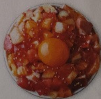
Kaisen Don 400.-