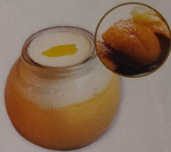
Uni Pudding 190.-