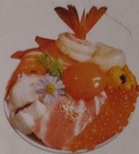
10 Ocean Don 680.-