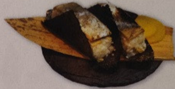
Saba Warayaki Sushi 150.-