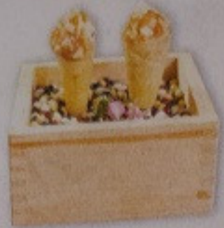
Seafood Yukke 90.-/ Pcs

麻葉豆腐卵 อาหารเรียกน้ำย่อย ไข่พรีเมียมเสิร์ฟ พร้อมซอสลิ้นจี่รสออสมอนด์