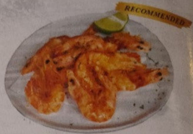
Can't stop drinking 150.-