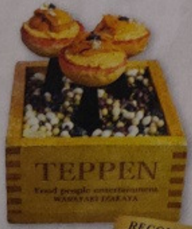
Teppen Ankimo Buger 180.-/pcs.

カニクリームコロッケ 雲丹ソース仕立て คาบิครีมโคโรคเกะ เสิร์ฟพร้อมอูนิซอสสุตุดันเข้มข้น