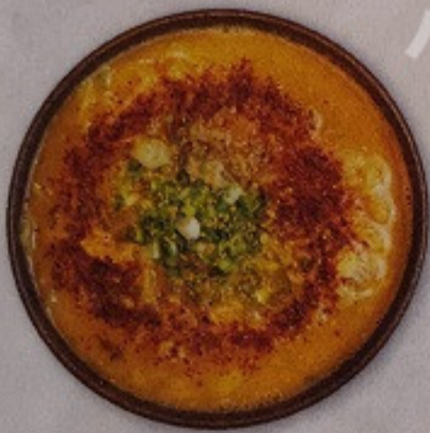
Paitan Ramen 280.-

九州の鳥の水炊き鍋の出汁と、 自家製太麺の鶏ラーメンです ラーメンチキンเส้นหนาแบบโฮมเมด และน้ำซุปก็เคี่ยวด้วยไก่จากภูมิภาคคิวชู *ลูกค้าสามารถปรุงรสความเข้มข้นได้เอง (เสิร์ฟพร้อมเกลือธรรมชาติ)