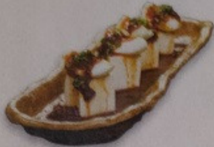
Drug Tofu Egg 150.-

麻葉豆腐卵 อาหารเรียกน้ำย่อย ไข่พรีเมียมเสิร์ฟ พร้อมซอสลิ้นจี่รสออสมอนด์