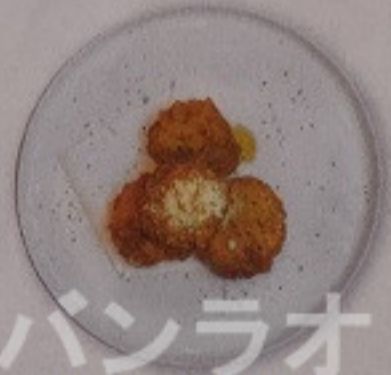
ハンラオ! Spicy Salmon Ball 230.-

自家製みそだれの餃子 เกี้ยวซ่าเสิร์ฟ พร้อมมิโซะซอสออสมอนด์