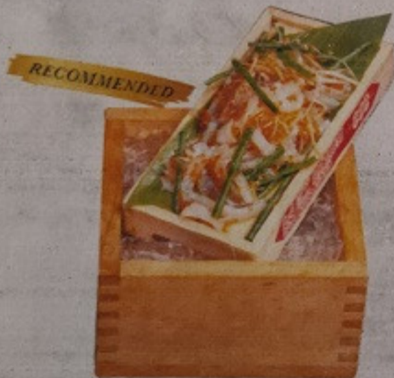
Spicy in Japan (But not in Thai) 250.-