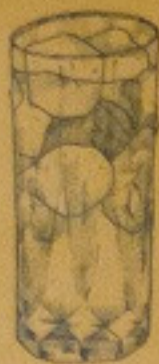
GIN x SANCHEO 250.-