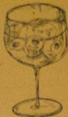
TEPPEN TONIC 250.-

อินลิ้ง อินลิ้งคิก สดใสดื่มแล้วชื่นของสดชื่น ผสมกับรสเค็มร้อนอย่างลงตัว ให้ความรู้สึกสดชื่น เหมาะสำหรับทานกับอาหารประเภทเนื้อ และอาหารที่ใช้น้ำมัน