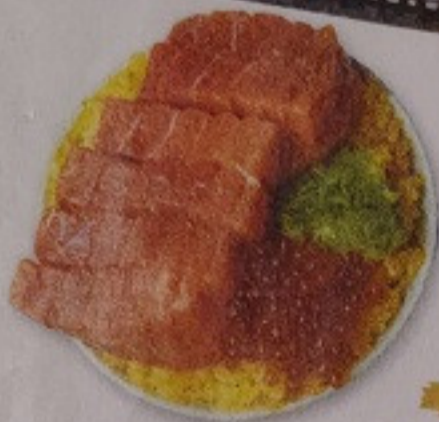
Otoro Sumibi Don 1,000.-