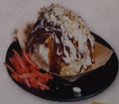
Takoyaki Potato Salad 250.-

雲丹、あん肝、のミニバーガー เบอร์เกอร์สไตล์แท้เป็น อูนิต้นปลาหมึกพิซ ราดด้วยราสเบอร์รี่ซอส