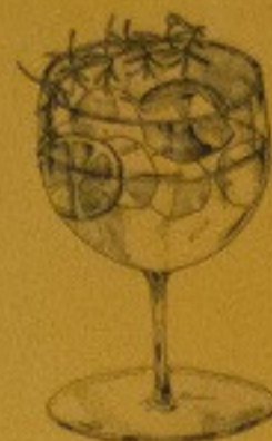
SMOKE ROSEMARY 250.-

คิงดรออย่างพิถีพิถันจนได้รสชาติ ละเอียดยิบยิบที่ลงตัว ซึ่งดีเฉพาะที่ TEPPEN เท่านั้น และสามารถทานคู่กับอาหารญี่ปุ่น ของ TEPPEN ได้ด้วย