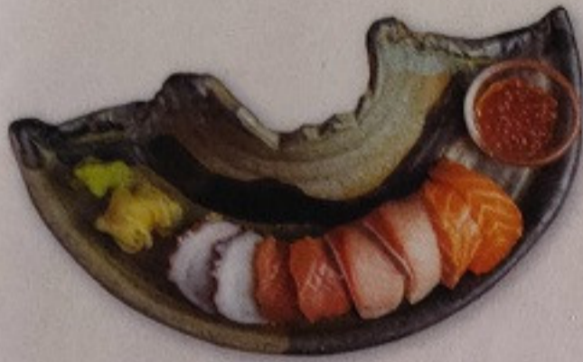
Rainbow Roll 350.-