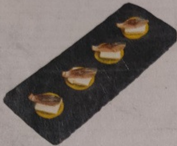
Cheese with me 150.-