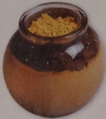
Hojicha Pudding 80.-