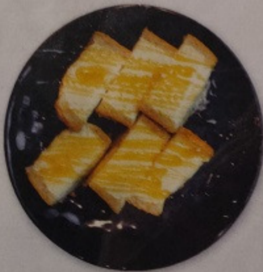
Honey Pan Ice 150.-

ハニーパンアイス ขนมปังสอดไส้ไอศกรีม และนำไปย่างให้ด้านนอกกรอบ!