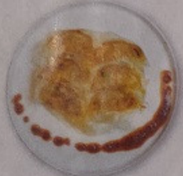
Gyoza ~Miso Sauce~ 150.-

フライドチキンwithタルタル ไก่ทอดสุตุดันตำรับแท้เป็น เสิร์ฟพร้อมทาร์ทาร์ซอส