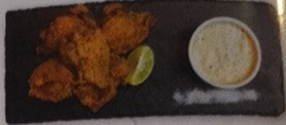
Frid Chicken with Tartar 150.-

海鮮ユッケ ยุคทะเล: ปลาดีบรวม (คัสโชะ แซลมอน และปลาหมึกทาโกะ)