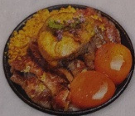
Wagyu Foie Gras Don 780.-